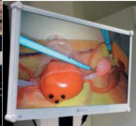
Näkyvyys kohdillaan harjoitellessakin.

järjestämällä mahtavilla boksivälineillä ja silikonisilla anatomiatarjottimilla.