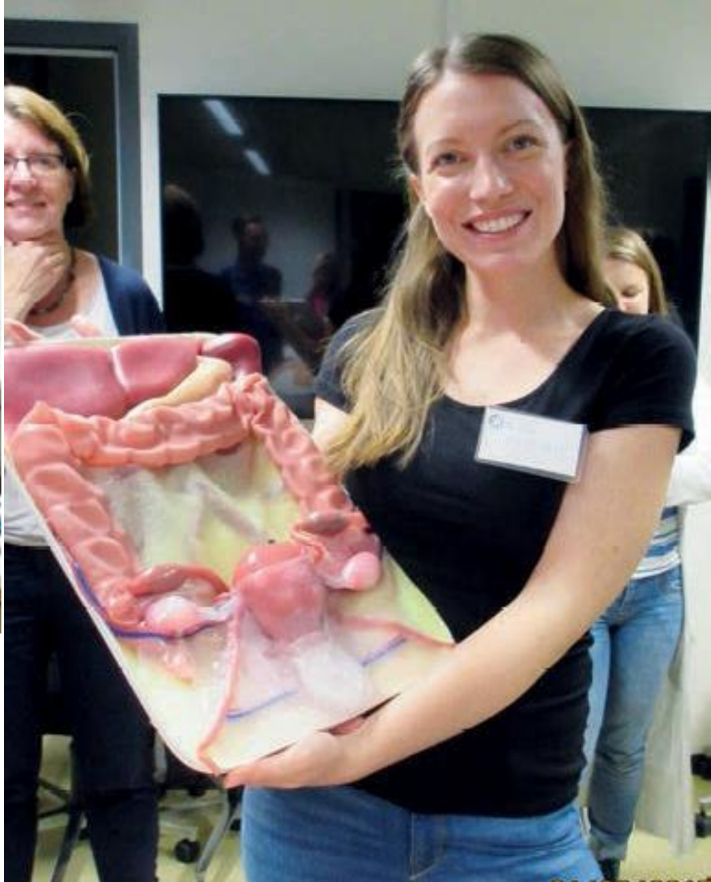
Innokkaana irrottelemaan tuubaa!

Gynekologiset leikkauskouluttajat olivat valmistelleet meille muutamia luentoja kattamaan gynekologista anatomiaa, adnexkirurgian perusteita, eri entrytekniikoita ja ehkä mielenkiintoisimpana oli sähkökirurgian perusteiden kertaaminen! Basic -kursilla meillä erikoistuvilla oli melko sa-